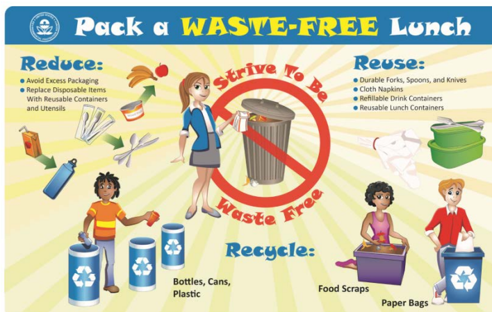
Five Simple Ways to Pack a Waste-Free Lunch